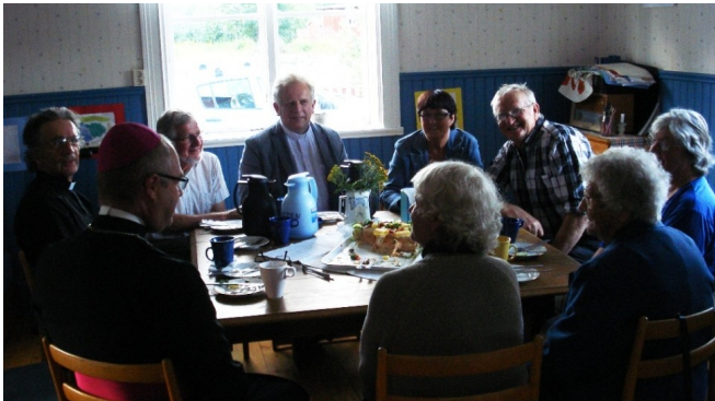
Samtal med kyrkkaffe efter gudstjänsten.