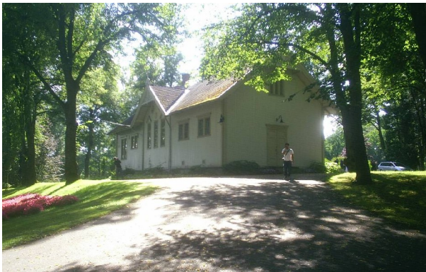
Johannes Döparens Kyrka i Oslo

Mer information finns på Nordisk Katolska Kyrkans hemsida ( www.nordiskkatolsk.no ).